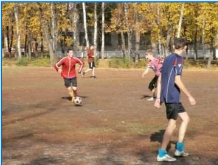
Гра між командами Ст-28 та Ас-13. Рахунок 4:1

I місце – гр. Ст-28; II місце – гр. Ст-29; III місце – гр. Тс-18.