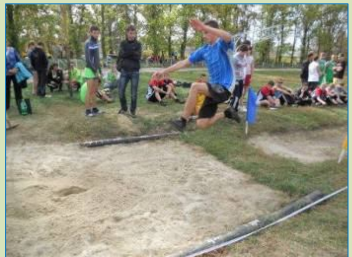
Обласні змагання з легкої атлетики